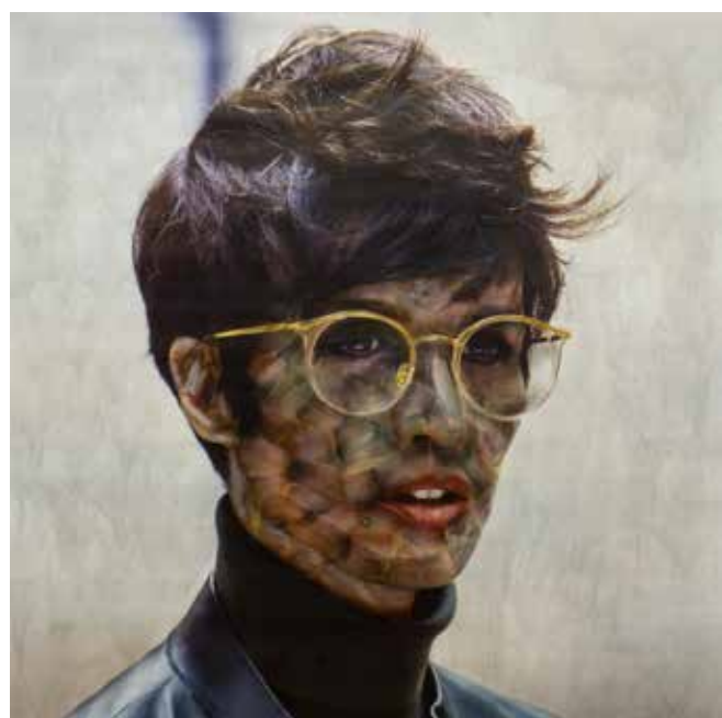
Vermibus, Iman, 2019. Dissolvant sur affiche publicitaire, 105 x 105 cm © Vermibus et courtesy Mazel Galerie