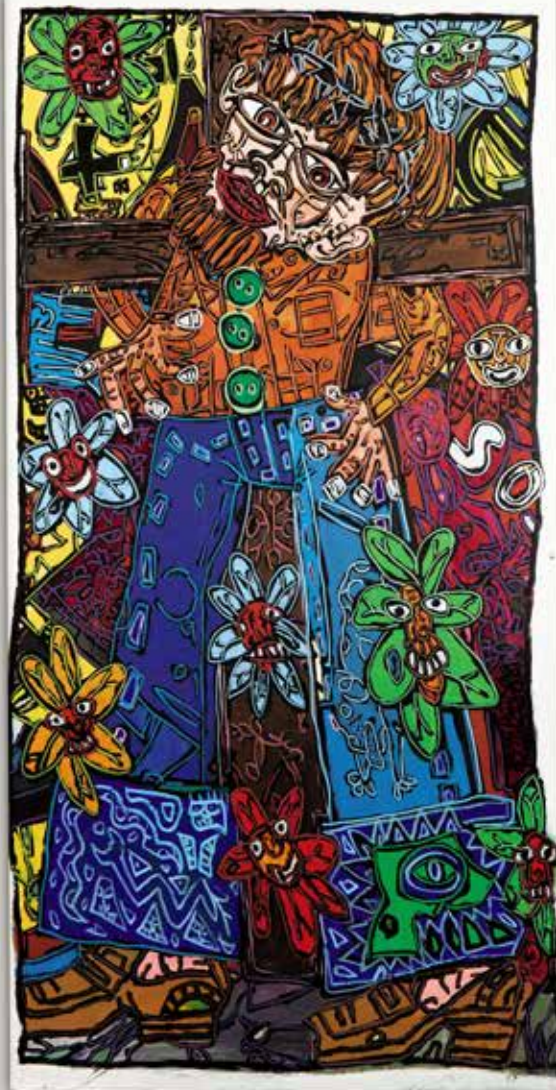
Robert Combas, Vintage 70 , 1988, acrylique sur toile, 210 x 105 cm

Philippe PASQUA. Ses Visages se matérialisent dans la couleur avec sincérité, révélant toute la vulnérabilité de l'être humain : la figure humaine est représentée avec la franchise du réalisme et l'intensité de l'expressionnisme.