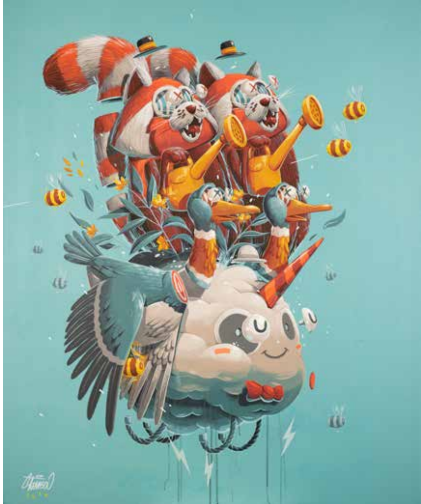
Stom500, Rain Guardians , 2019, acrylique sur toile, 120 x 100 cm © Stom500 et courtesy Mazel Galerie

Avec une prédilection pour les thèmes animaliers qui, sous le vernis de la drôlerie, portent un message pertinent, souvent à caractère humaniste ou écologique. A l'image de ses tourbillonnantes abeilles ou de ses bestiaires apparemment incompatibles, tels le corbeau et le renard inspirés des fables de La Fontaine, symboles du vivre-ensemble.