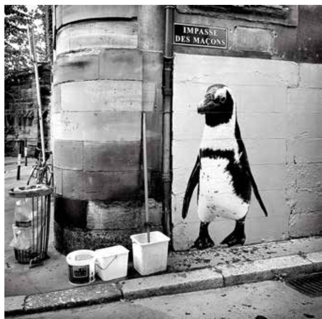
Sonac, Manchot impasse des maçons, Strasbourg, 2018. Tirage photographique sur papier - 60 x 60 cm, 100 x 100 et 140 x 140 cm - édition de 10, 5 et 3 exemplaires