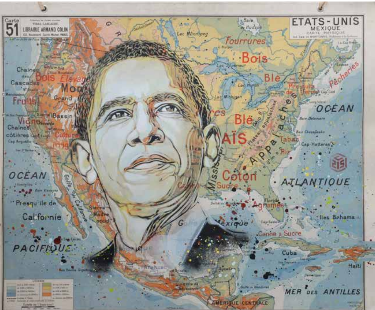
C215, Obama, 2018, pochoir et aerosol sur carte scolaire, 100 x 120 cm © C215 et courtesy Mazel Galerie