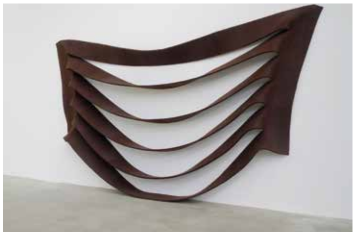
Robert Morris, Untitled , 1969. Feutre, 255 x 453 cm © ADAGP, Paris 2017