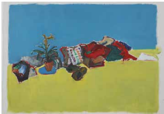
Damien Cabanes, Intérieur d'atelier , 2016, huile sur toile, 217 x 289 cm