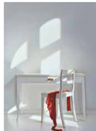
Edite Grinberga, Schreibtisch mit Stuhl und rot , 2016, 180 x 120 cm.