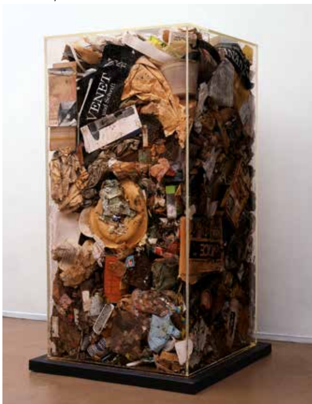
Arman, La Poubelle de Bernar Venet , 1971. Déchets dans Plexiglas, 126,5 x 61 x 61 cm