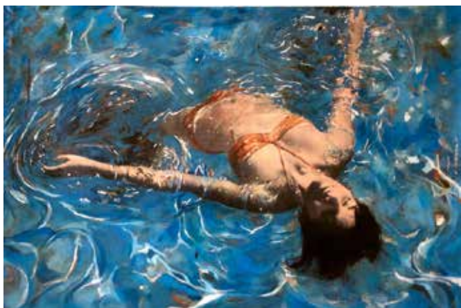
Ayline Olukman, Flipside . Technique mixte sur toile, 80 x 120 cm.

AEDAEN GALERIE - France - www.aedaen.com | GALERIE ARNOUX - France - www.galeriearnoux.fr | GALERIE AU-DELA DES APPARENCES - France - www.galerie-audeladesapparences.com | REMY BUCCIALI - France - www.editionsbucciali.com | CASCADE ART SPACE - Allemagne - www.cascade-artspace.com | GALERIE LE CONTAINER - France - www.galerielecontainer.com | L'ESTAMPE - France - www.estampe.fr | GALLERIA FORNI - Italie - www.galleriaforni.com | GALLERIA STEFANO FORNI - Italie - www.galleriastefanoforni.com | GALERIE PASCAL GABERT - France - www.galeriepascalgabert.com | GALERIE BERTRAND GILLIG - France - www.bertrandgillig.fr | GALERIE BERNARD JORDAN - Allemagne - www.galeriebernardjordan.com | GALERIE KAHN - France - www.galeriekahn.com | JEAN-FRANCOIS KAISER GALERIE - France - www.jeanfrancoiskaiser.com | GALERIE LUMEN - Allemagne | GALERIE MATHIEU - France - http://galeriemathieu.blogspot.fr | GUY PIETERS GALLERY - Belgique - www.guypietersgallery.com | LA POPARTISERIE - France - www.lapopartiserie.com | RADIAL ART CONTEMPORAIN - France - www.radial-gallery.eu | GALERIE LUZIA SASSEN - Allemagne - http://galerie-luzia-sassen.de | SOBERING GALERIE - France - http://soberinggalerie.com | GALERIE CHRISTOPHE TAILLEUR - France - www.galeriechristophetailleur.fr