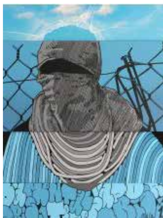
GRIS 1, Graffiti Dress Code , 2016. Acrylique et bombes sur assemblage de toile et de bois, 120 x 100 cm.