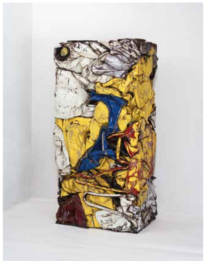
César, Carrosseries de voitures compressées, 1989. 162 x 78,5 x 56 cm