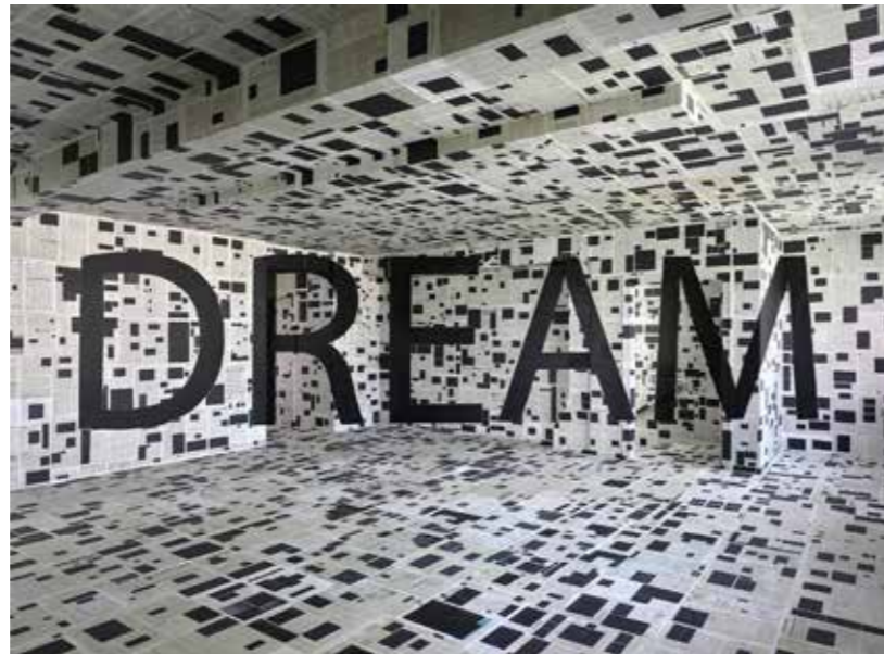
Georges Rousse, Dream , 2017. C-Print contrecollé sur Dibon cadre noir, 180 x 240 cm. Edition unique

Georges Rousse est né en 1947 à Paris où il vit et travaille. Georges Rousse est assurément photographe ce que révèle la qualité intrinsèque de ses images dont il assure lui-même la prise de vue, le cadrage, la lumière. Mais il est aussi, tout autant, peintre, sculpteur, architecte dans le même rapport avec les espaces réels qu'un peintre avec la toile, un sculpteur avec la matière, ou un architecte face à ses plans. Son matériau premier est l'Espace. L'espace de bâtiments abandonnés où il repère immédiatement un «fragment» pour sa qualité architectonique, sa lumière puis qu'il organise et met en scène dans le but ultime de créer une image photographique. A partir de la vision de l'objectif, il construit dans ces Lieux du vide une œuvre utopique, y projetant sa vision du monde, son « univers » mental, croisant des préoccupations plastiques en résonance avec le lieu, son histoire, la culture du pays où il intervient.