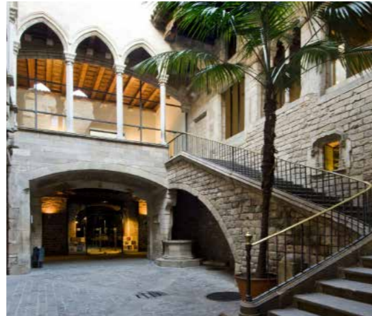
Palau Berenguer d'Aguilar, 18/05/2009 - Museu Picasso, Barcelona

L'objectif principal du Museu Picasso est de promouvoir les connaissances et la recherche sur l'œuvre de Pablo Picasso, à la fois localement et globalement. Notre musée est l'un des musées les plus importants exclusivement consacré à la figure de l'artiste et le premier à avoir été fondé, il y a plus de cinquante ans. Les œuvres de sa collection permanente sont essentielles pour explorer les premières années de la formation de l'artiste et son dévouement à la gravure, comme en témoigne la série complète de Las Meninas - Les Ménines. Situé dans un cadre architectural exceptionnel, un ensemble de cinq édifices gothiques, le musée a été conçu comme un espace de promotion de l'art et du savoir au service de l'artistes, de la ville et de ses visiteurs. Grâce à son origine et à sa collection, le musée est la preuve vivante de la connexion entre Pablo Picasso et Barcelone www.museupicasso.bcn.cat