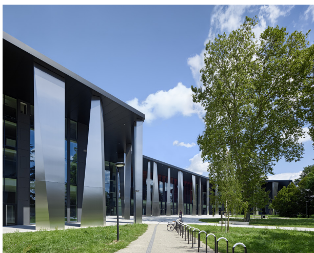
Place de Bordeaux 67000 Strasbourg

Société d'économie mixte détenue par la Ville, l'Eurométropole de Strasbourg et le groupe GL events, Strasbourg Events met au service des organisateurs d'événements 50 ans d'expertise reconnue dans l'accueil de manifestations internationales exigeantes et l'accompagnement des organisateurs, doublée d'une solide expérience d'organisation d'événements professionnels et grand public. Strasbourg Events gère et exploite le Palais de la Musique et des Congrès déployé sur 50.000 m 2 , auxquels s'ajoutent près de 24.000 m 2 du nouveau Parc des Expositions attenant devenant un outil combiné unique.