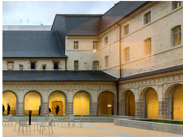
Couvent des Jacobins, Rennes.

« Le lieu offre une expérience visuelle et architecturale absolument exceptionnelle. L'idée de présenter notre travail dans un espace aussi fort, à la fois patrimonial et contemporain, s'est imposée naturellement. »