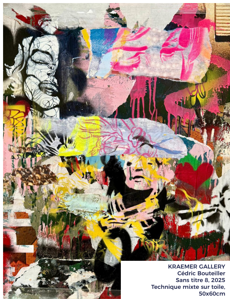
KRAEMER GALLERY Cédric Bouteiller Sans titre 8, 2025 Technique mixte sur toile, 50x60cm