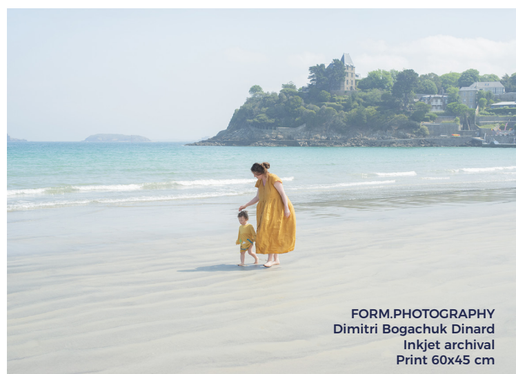
FORM.PHOTOGRAPHY Dimitri Bogachuk Dinard Inkjet archival Print 60x45 cm