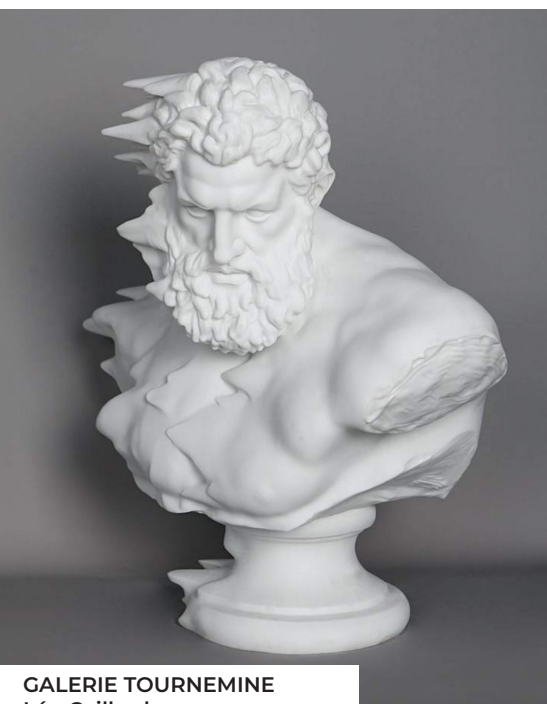
GALERIE TOURNEMINE Léo Caillard Hercules in the wind, 2025 Résine marbrée, 70x77x39cm