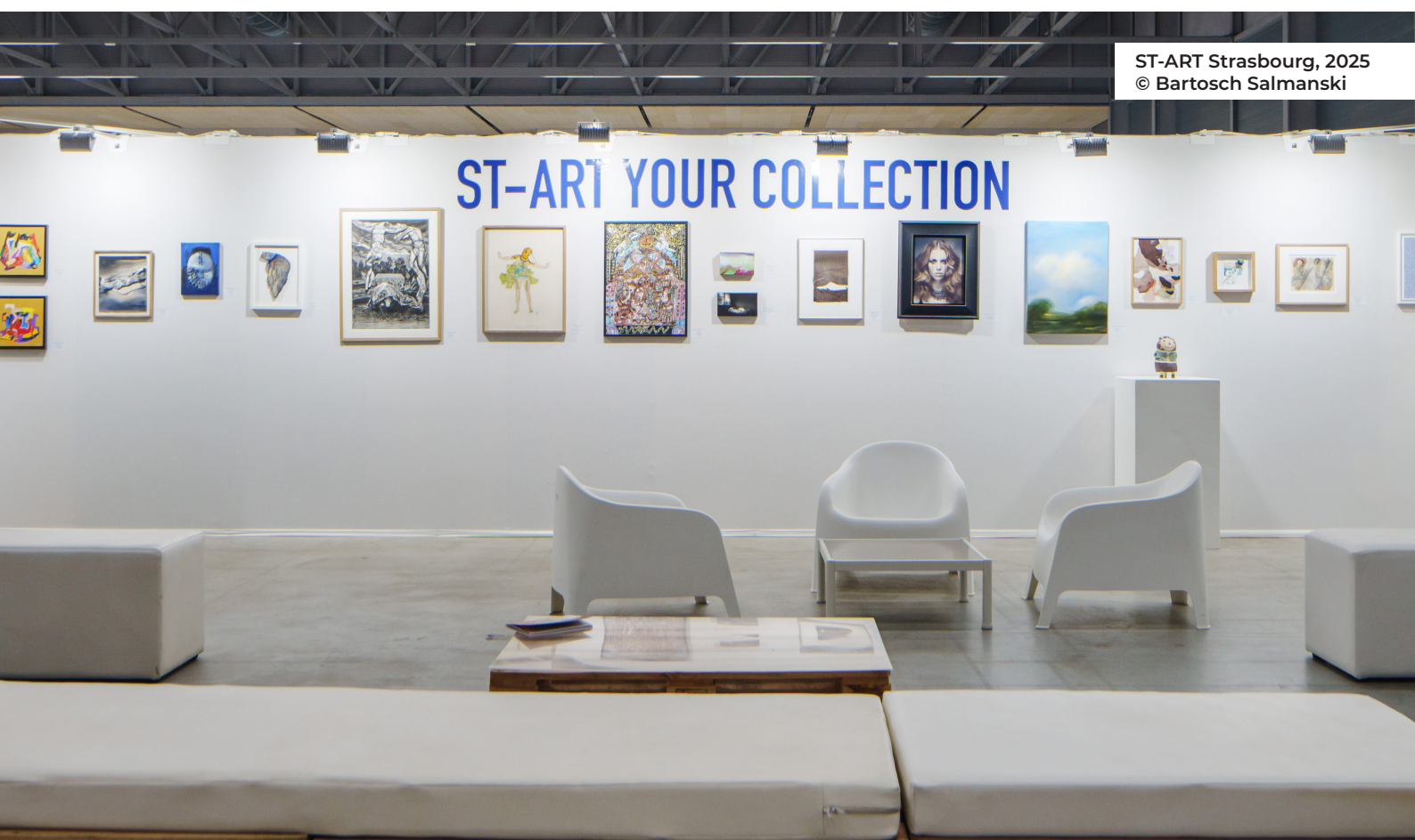
ST-ART Strasbourg, 2025

L'objectif est clair : démystifier l'achat d'œuvre d'art . Que ce soit pour acquérir une première pièce « coup de cœur » ou enrichir une collection établie, la foire est pensée comme un lieu de rencontres et d'échanges avec les galeries.