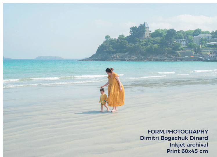
FORM.PHOTOGRAPHY Dimitri Bogachuk Dinard Inkjet archival Print 60x45 cm