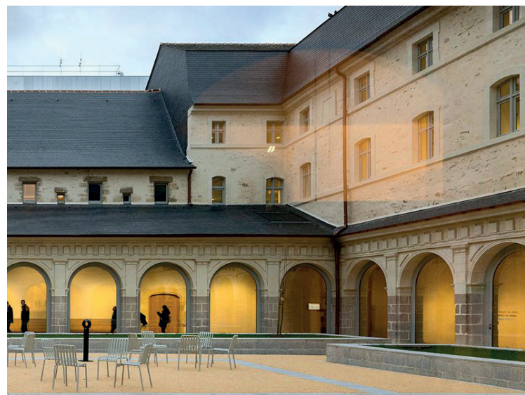
Couvent des Jacobins, Rennes.

« Le lieu offre une expérience visuelle et architecturale absolument exceptionnelle. L'idée de présenter notre travail dans un espace aussi fort, à la fois patrimonial et contemporain, s'est imposée naturellement. »