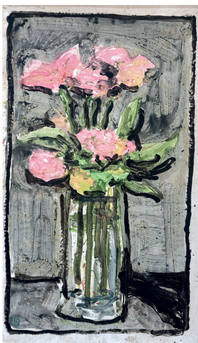
LA BOUCHERIE Charlotte de Maupeou Le bouquet, 2024 Tempera sur papier marouflé, 58x82cm

Le plateau artistique réunira une trentaine de galeries, créant un pont inédit entre les acteurs locaux et nationaux : un ancrage régional fort avec la présence confirmée de la Galerie Form. Photography (Dinard), la Galerie La Boucherie (Saint-Briac-sur-Mer), la Galerie Calderone (Dinard) ou la Galerie Tournemine (La Baule-Escoublac) associé à une ouverture nationale avec des enseignes venues de Montpellier (AD Gallery), Strasbourg (Kraemer Gallery), Toulouse (Galerie Schanewald, Pol Lemétais), Nice (Authentic Nice Gallery) ou Paris (ART Trope).