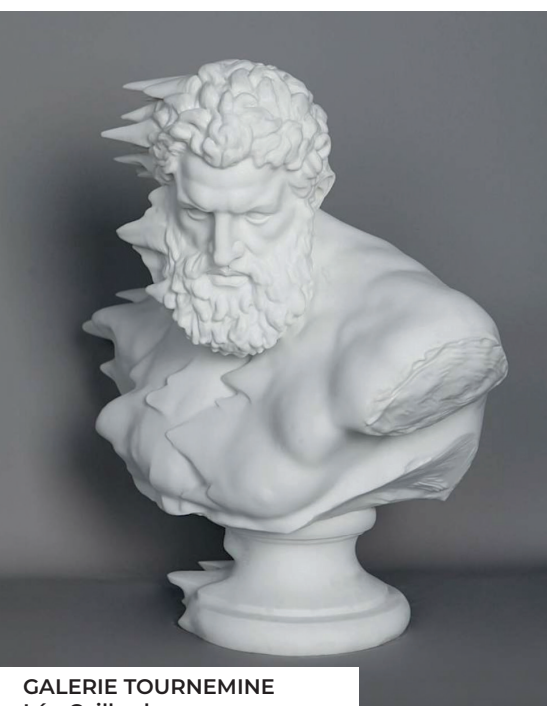
GALERIE TOURNEMINE Léo Caillard Hercules in the wind, 2025 Résine marbrée, 70x77x39cm